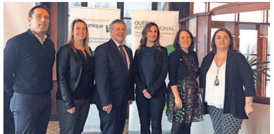
Les partenaires associés au projet de Passerelle de l'emploi en Chaudière-Appalaches.

Cette annonce coïncidait avec le coup d'envoi de la toute première cohorte de co-développement « Recruteurs de talents » en Chaudière-Appalaches. Un groupe de quatorze participants de la région aura accès à une offre de service intégrée et sur mesure adaptée à leurs besoins.